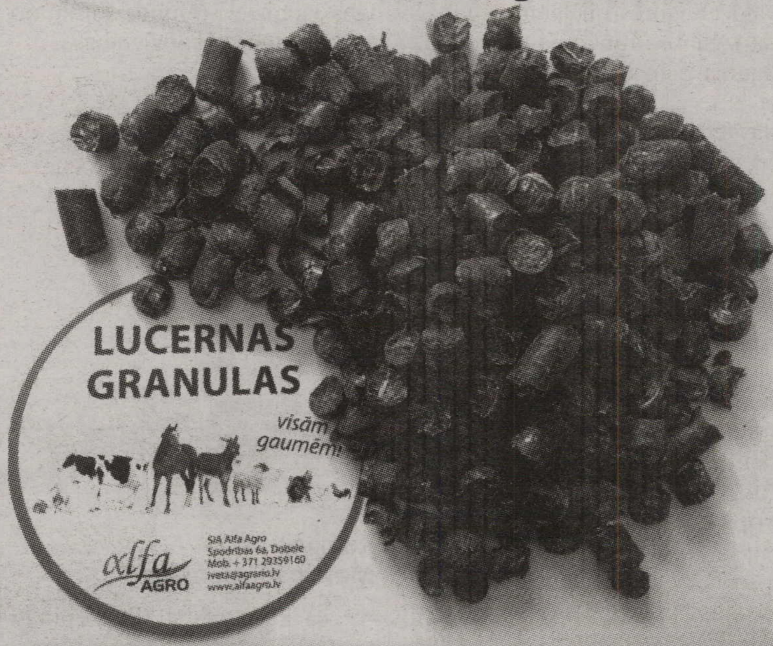
SIA «Alfa Agro» ražotās lucernas granulas

Jā, maksātnespējas administrators it kā pārstāv kreditoru intereses, bet kreditori jau ir tie paši zemnieki. Jāteic gan, ka arī citām firmām, piemēram, par minerālmēsliem palikām parādā un zemniekiem par graudiem. Parādu